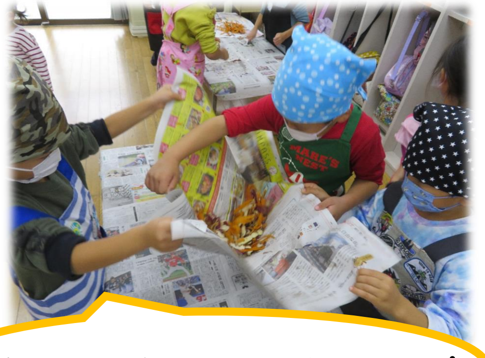
剥き終わった皮の片付けもまかせてっ✨