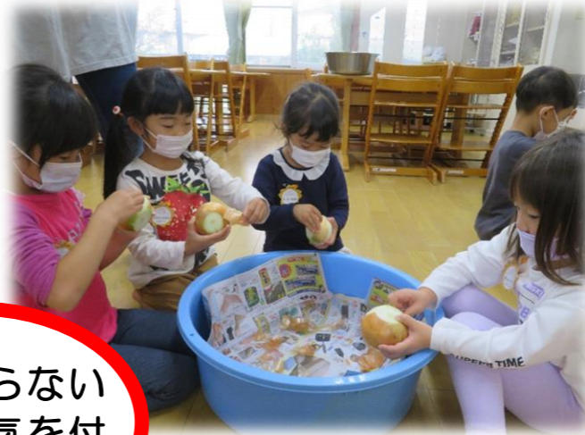
うぐいすさんは 玉ねぎの皮剥きっ🎵 1枚1枚丁寧に… なんだか目に染みて 涙が出そうになって きたよー!💧