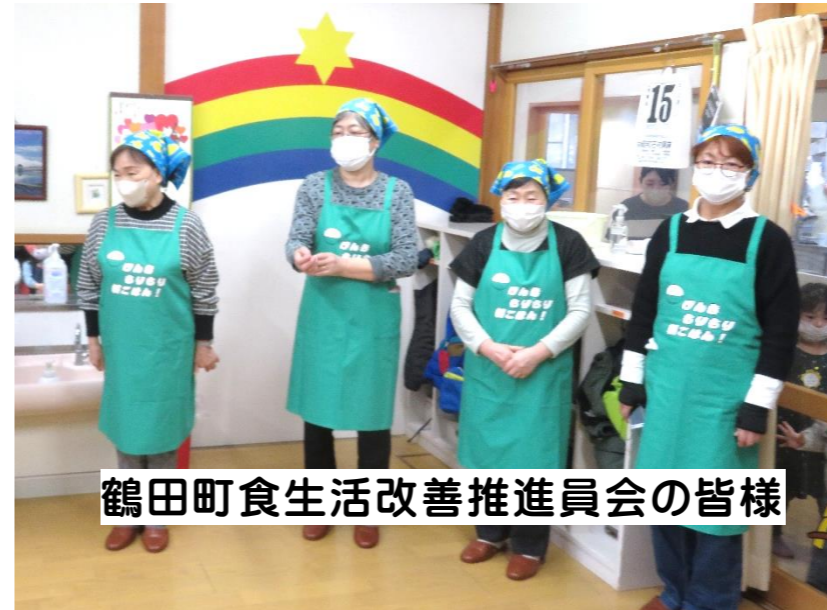
鶴田町食生活改善推進委員会の皆様

「早く食べたいよ！」と本当は昼食時に食べる予定でしたが、その場で温かいうちに、いただいた園児もいたようです。「つくるって楽しいね!」「食欲いっぱい!」 笑顔も食欲も喜びもモリモリ の園児たちでした!